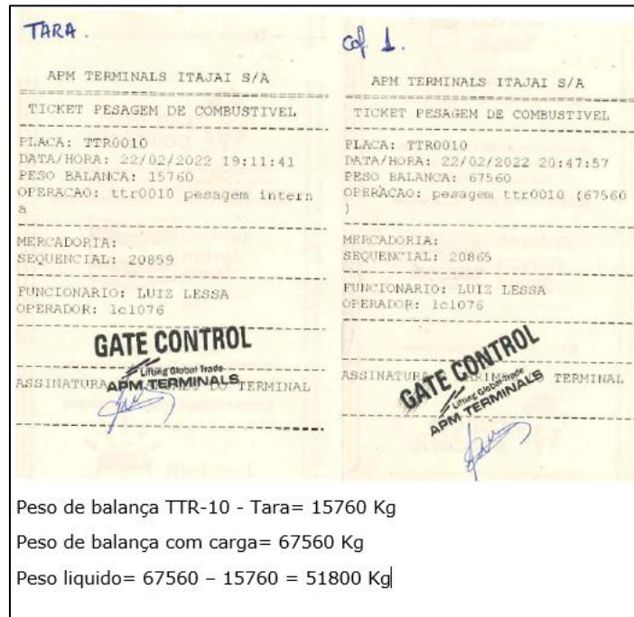
Figura 2. Comprovante de pesagem da carga de teste utilizada.