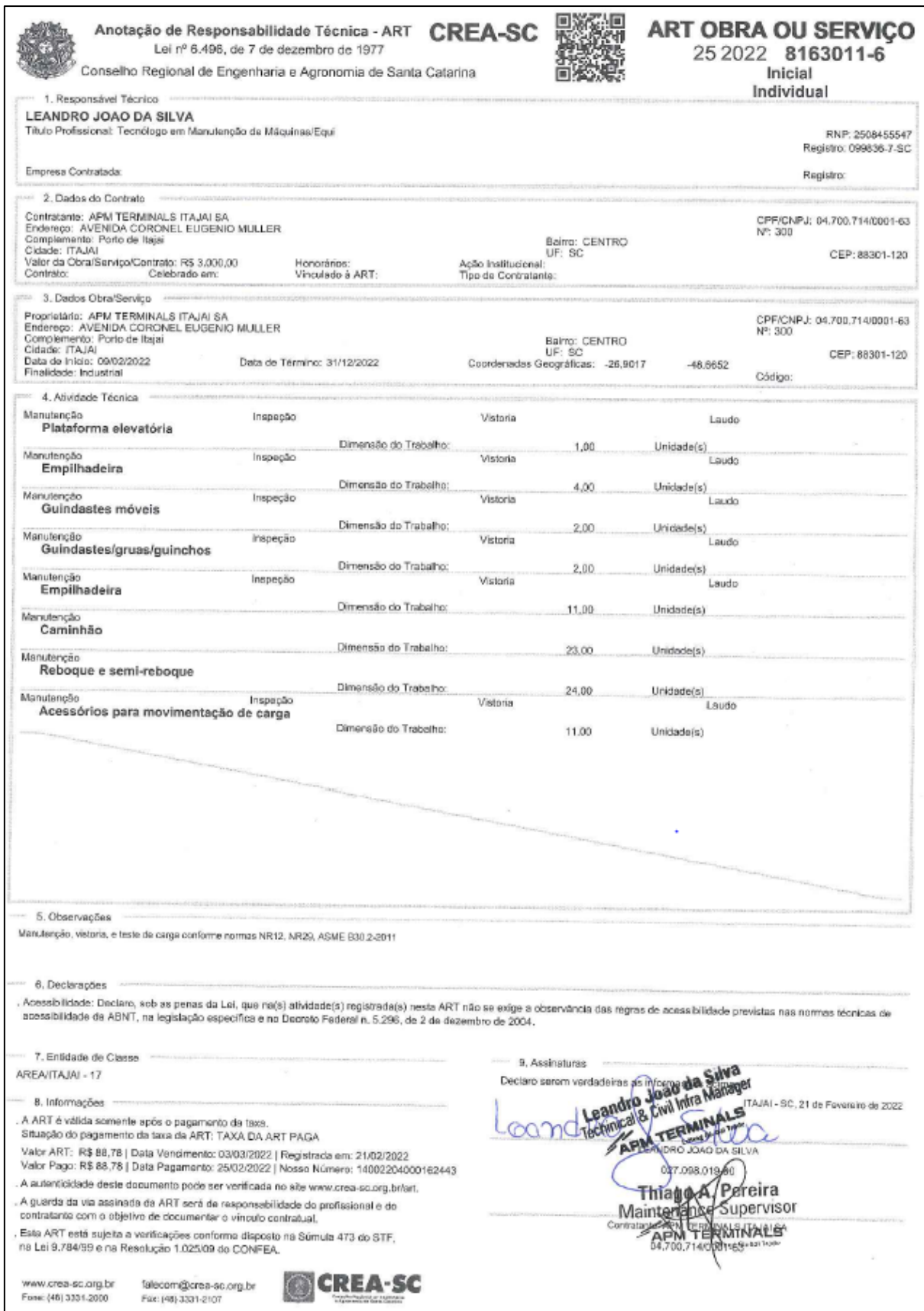
Anexo 2. Anotação de Responsabilidade Técnica (ART)