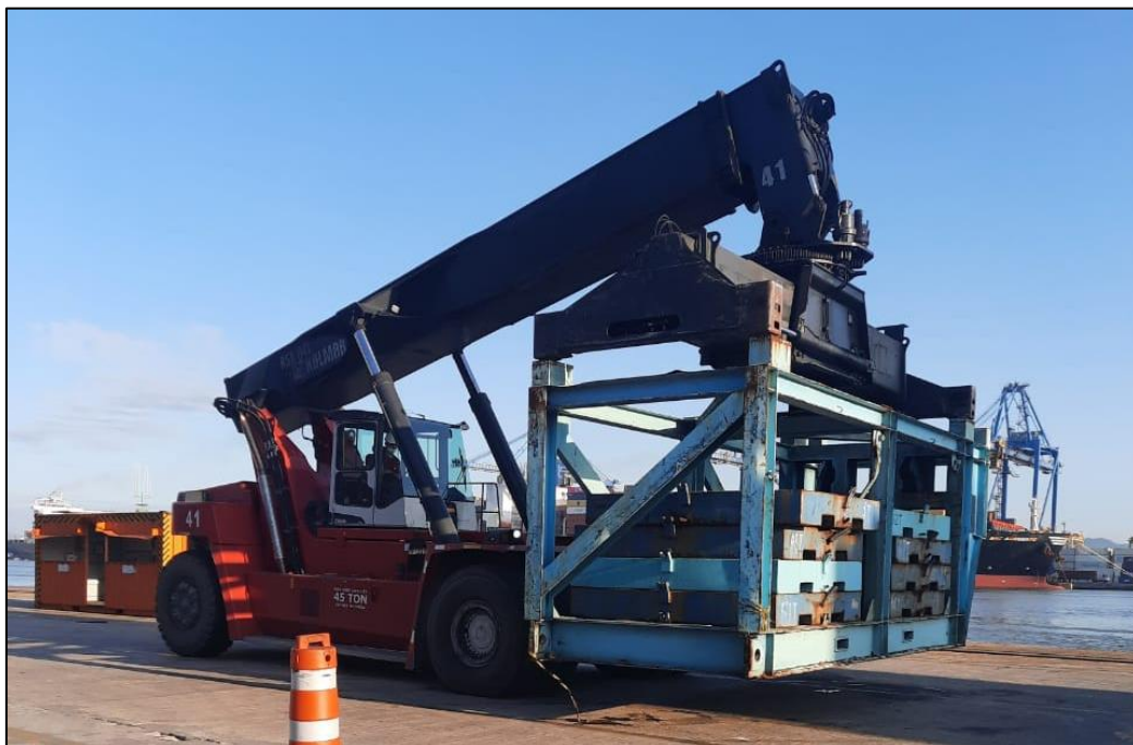
Figura 3. Teste de carga.