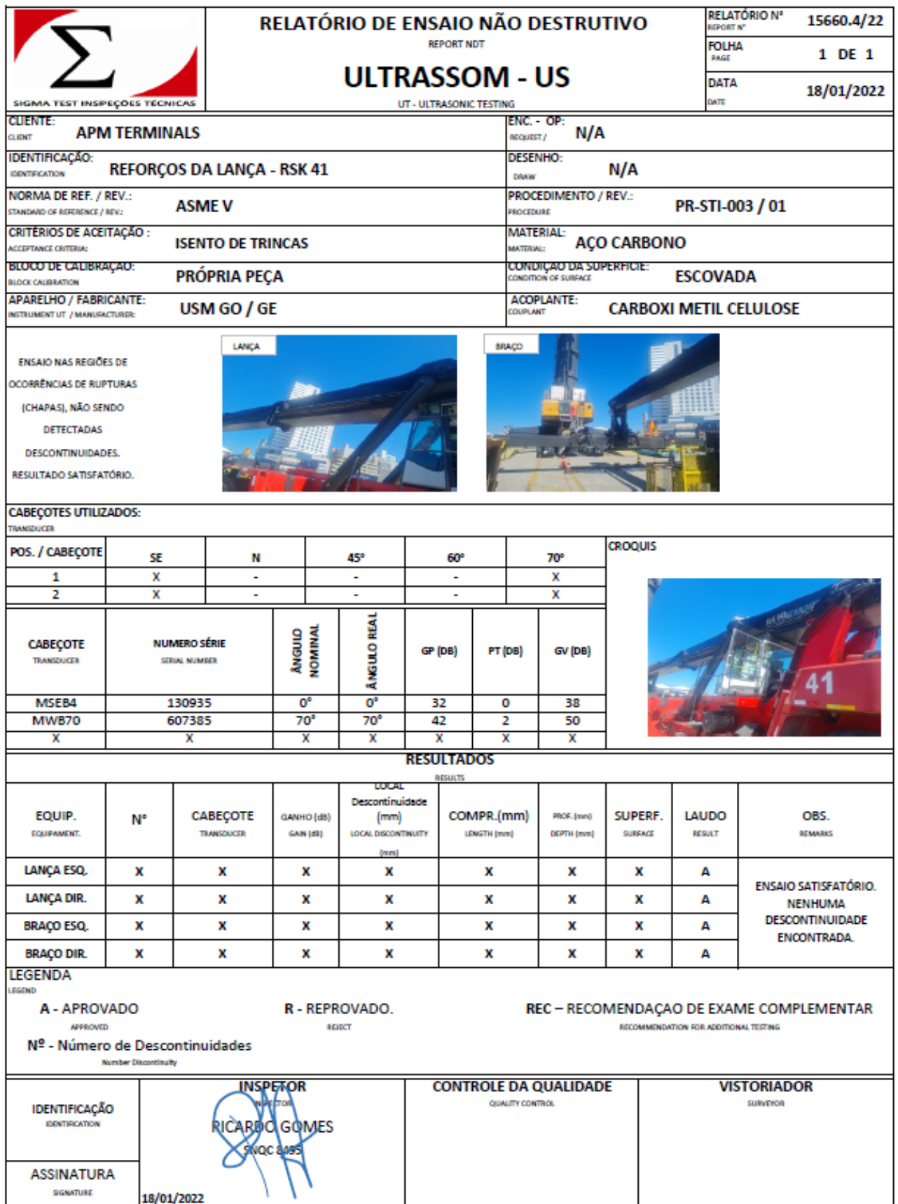
Anexo 3. Relatório de ensaio por ultrassom na lança e no spreader, ensaio satisfatório.