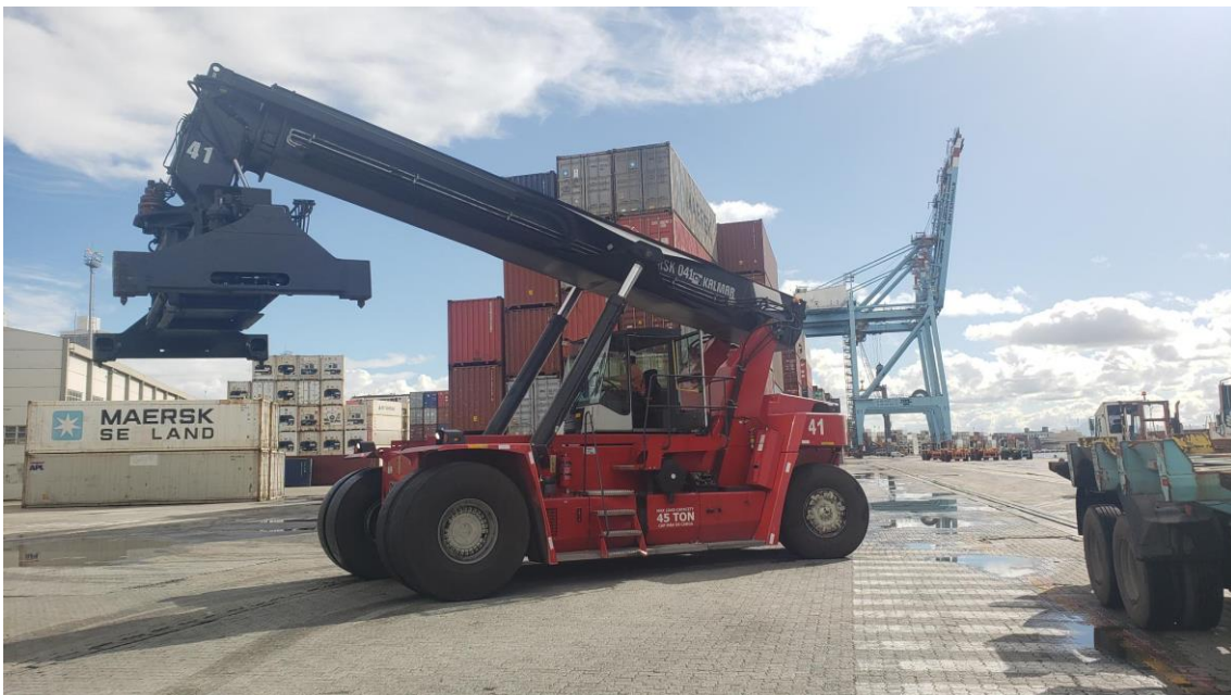
Figura 1. Empilhadeira de grande porte (Reach-Stacker), RSK-0041.