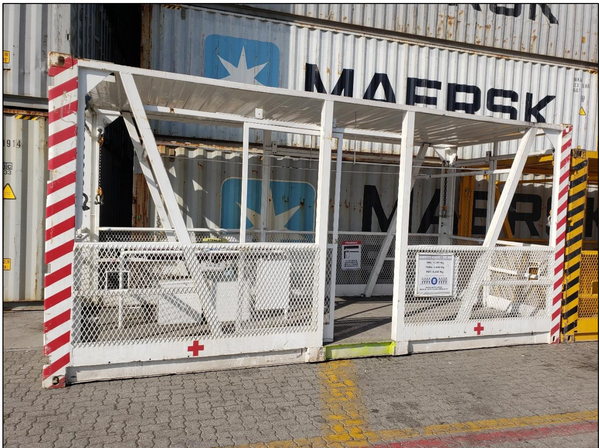
Figura 1. Safty Cage - 04