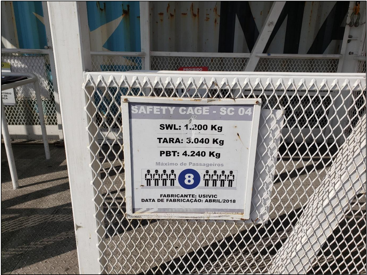
Anexo – 3 imagem da placa de identificação