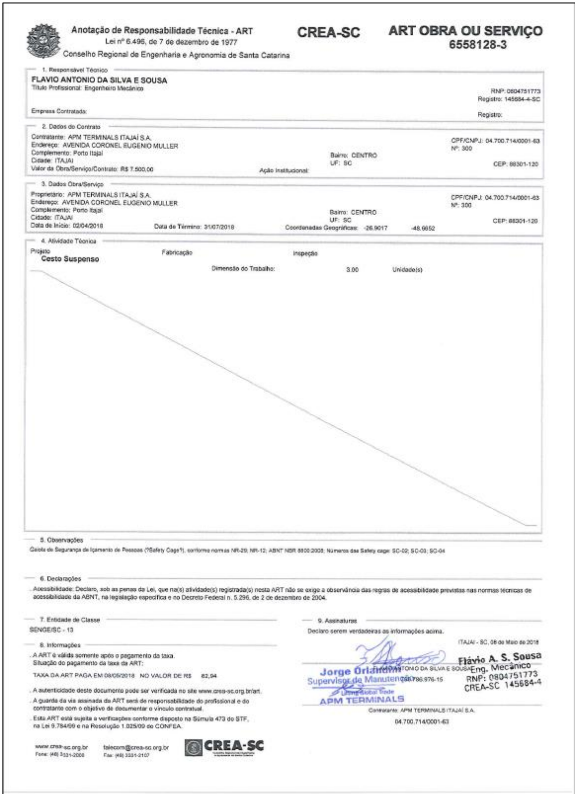
Anexo – 2 Anotação de Responsabilidade Técnica (ART) do projeto de fabricação